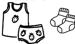
下着 (パンツ、シャツ) 靴下