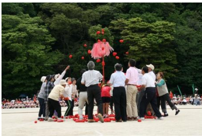
来賓玉入れ。子どもに負けるな！