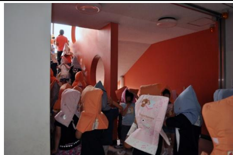
4階に向かって階段を上がる児童たち

つ、どの児童も実際に大きな地震を経験したばかりなだけあって、真剣な面持ちで訓練に臨んでいたようでした。