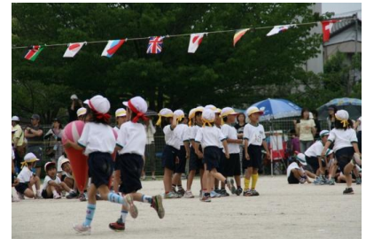
一年生・初めての運動会。ドキドキ…