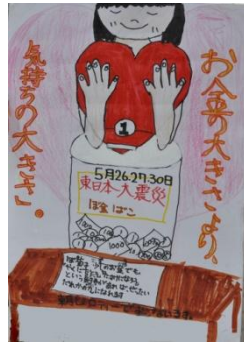
「お金の大きさより気持ちの大きさ」

に「お願いします！」大きな声がピロティーに響き渡ります。「お小遣の中から」募金するのが原則。小さな手に握りしめられた一人一人の想いが、募金箱にたくさん集まりました。 この気持ちが被災地に少しでも届きますように…。