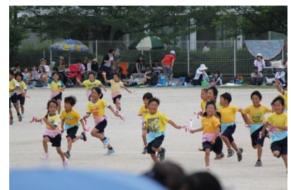
マルマルモリモリ！ かわいく元気に踊れました