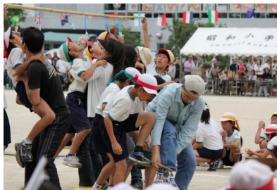
六年生・親子競技。重たくなった我が子