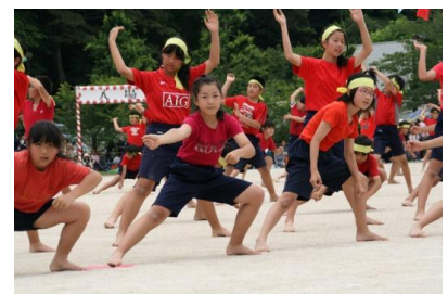
迫力のある昭和ソーラン！