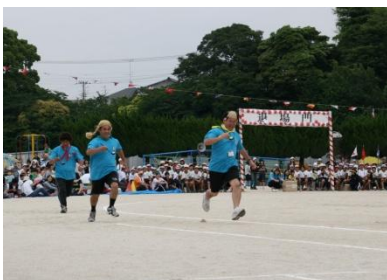
PTAリレー。今年はなんと…カツラがバトン!?